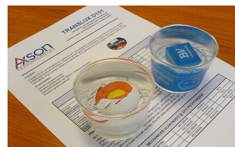
"testery"- mísicí poměr 100/60 a 100/100